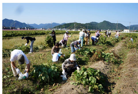
丹波黒枝豆もぎ取り体験のイメージ